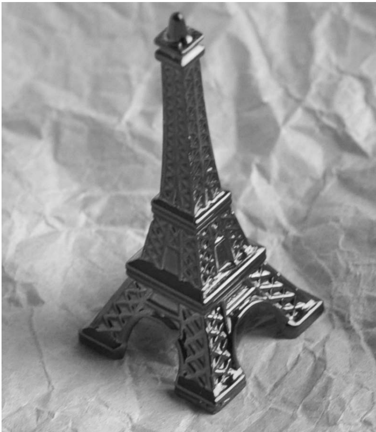
Vogel- en kikkerperspectief

is een boek. Een tekst heeft heel andere mogelijkheden dan een voordracht en vice versa. Een bewijsvoering uit een boek waarvoor flink gebladerd moet worden kan minder geschikt zijn tijdens een voordracht omdat dan rekening moet worden gehouden met de beperkte capaciteit van het korte termijngeheugen van de toehoorders. Probeer een vorm te vinden die beter bij de presentatie past. Laat bijvoorbeeld referentiemateriaal op een apart bord of scherm staan. Praat nooit over dingen die je niet helemaal begrijpt, al is de verleiding nog zo groot. Het zal je net gebeuren dat iemand uit het publiek, vaak zonder kwade opzet, een vraag stelt, precies over deze zwakke plek in je verdediging. Als dit toch gebeurt, geef dan ruiterlijk toe dat je hier nog vraagtekens hebt. Het punt kan dan mogelijk in de groep besproken worden. Dit moet natuurlijk niet