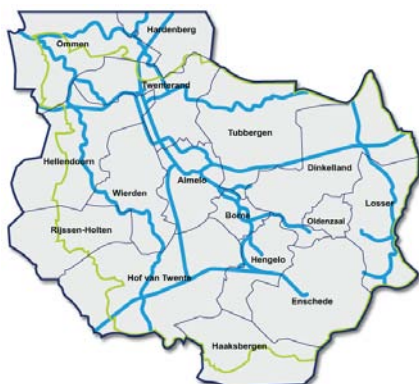
Figuur 1 Het beheergebied van het waterschap

Het waterschap Regge en Dinkel is in de regio Twente verantwoordelijk voor het waterbeheer in een gebied van veertig bij veertig kilometer, waarin de steden Almelo, Hengelo en Enschede liggen. De belangrijkste waterwegen in dit gebied zijn de twee rivieren: de Regge en de Dinkel. Allebei stromen ze uit in de Vecht, die buiten het beheergebied van het