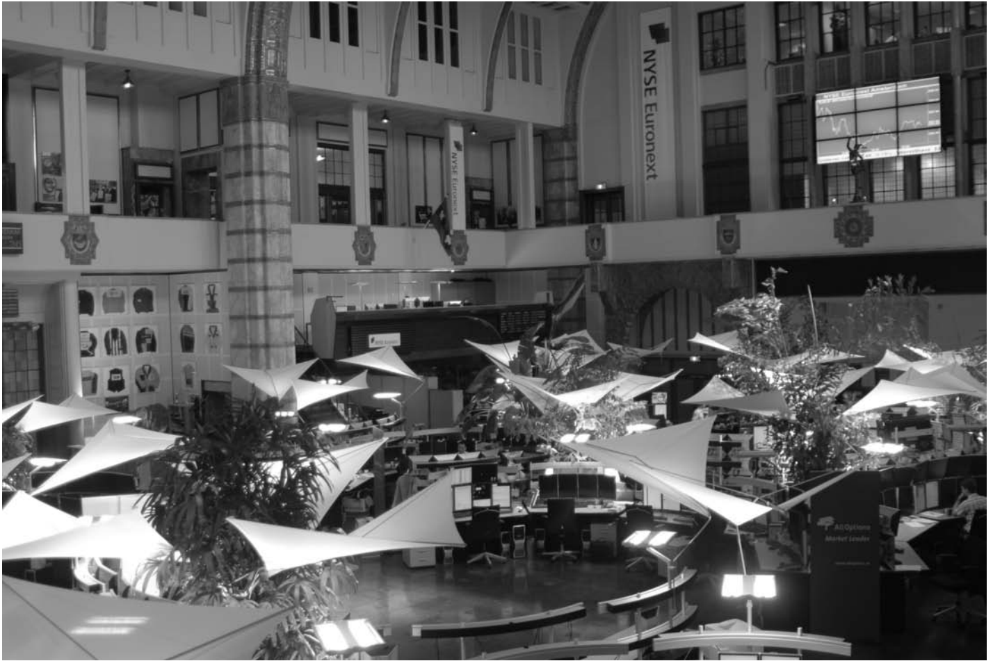
De kantoortuin van All Options in de voormalige handelsvloer