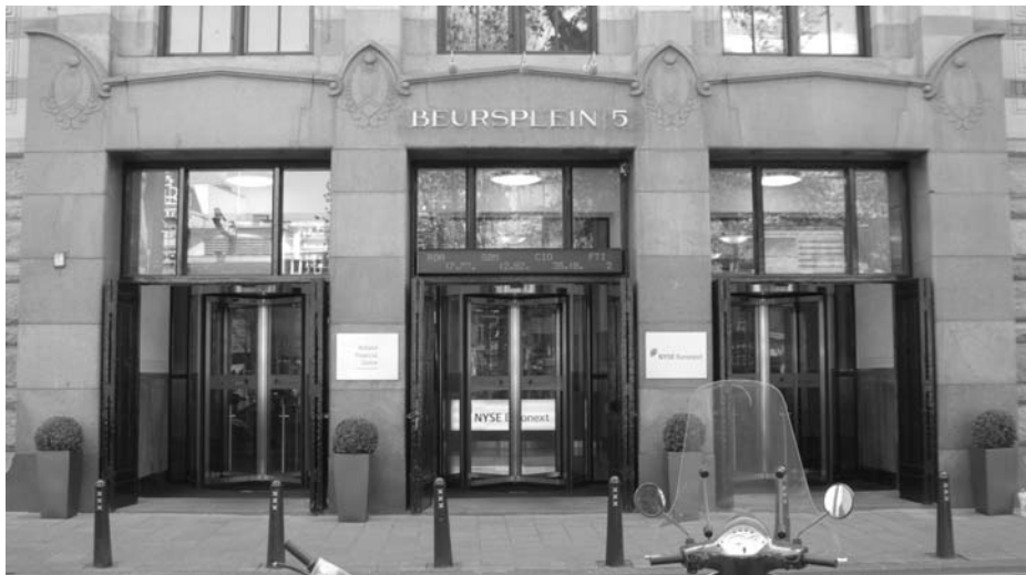
Ingang Beursplein 5

voorwerpen en de antieke barbiersstoel, en enige jaloezie borrelt al direct op!