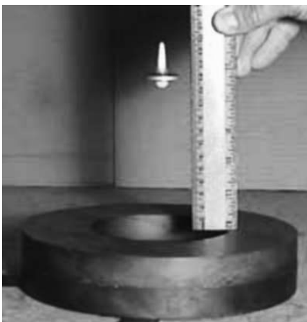
Figuur 1 Het Levitron: levitatie van een draaiend magneetje in een magnetisch veld

Pas in 1983 zag uitvinder Harrigan in dat voor een roterend magneetje deze stelling omzeild kan worden; hij bouwde vervolgens een prototype van wat nu bekend staat als het ‘Levitron’. De aanhoudende verwarring over de werking van dit vernuftige apparaat is uiteindelijk weggenomen door Berry [3].