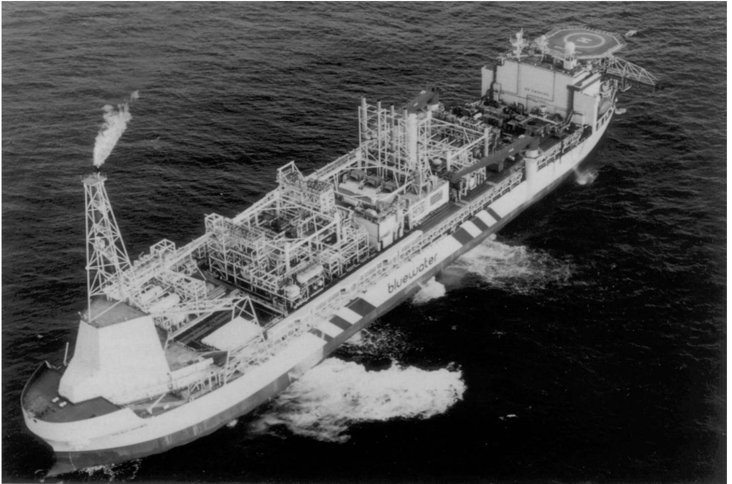
Het technologie-instituut MARIN heeft de vorm van het schip Bluewater geoptimaliseerd.