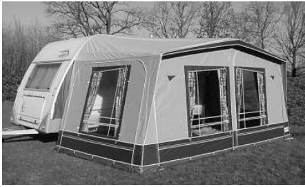
Figuur 2 De uitdaging: verwijder de kreukels uit het dak van deze tent.

ring mee) dat deze Studiegroepen nieuwe inzichten leveren, nieuwe onderzoekswegen inslaan, aanleiding geven tot nieuwe soorten wiskunde, en misschien het belangrijkste, dat in de meeste gevallen de industriële tevreden naar huis gaan, vol nieuwe ideeën en met vernieuwd élan? Het antwoord is simpel: alweer omdat het leuk is. Het is leuk om samen met andere geïnteresseerde wiskundigen een ad hoc team te vormen, samen de uitdaging aan te gaan, en samen er hard aan te trekken om het probleem zo goed mogelijk aan te pakken. En met de verenigde kennis en inzicht van je teamgenoten blij je in slechts enkele dagen een verbazingwekkend begrip te kunnen creëren van de situatie van je industrieel en het probleem helemaal als jouw probleem te gaan zien. De suggesties voor verbetering komen dan vanzelf.