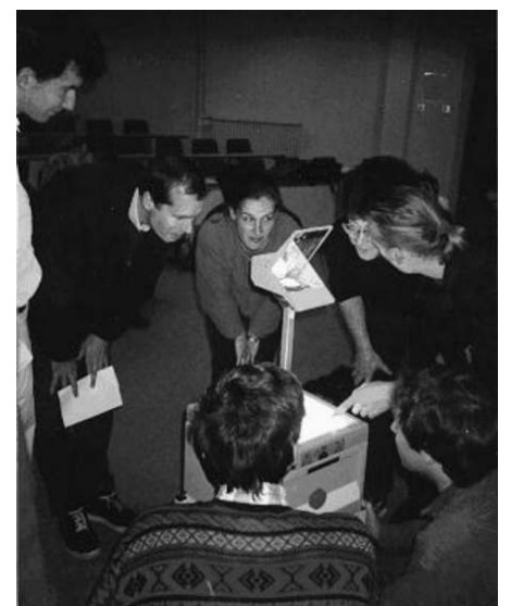
Figuur 1 Een experiment: zelfgemaakte verf laten drogen. 'Watching paint dry' is Engels idioom voor iets dat zinloos en saai is. Het feit dat wiskundigen zich daarmee bezig hielden heeft alle kranten gehaald.

Waarom blijkt desondanks al vele jaren (in Engeland hebben ze hier al dertig jaar erva-