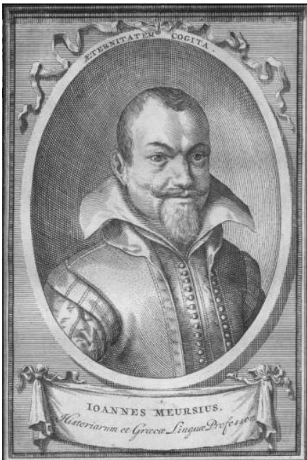
Figuur 1 Johannes Meursius (1579–1639)

Diegenen onder U die hier gekomen zijn om alvast een voorschot op hun weekend te nemen, hebben het bij het verkeerde eind gehad. De illustraties die U voor U heeft maken