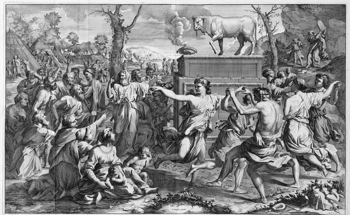
Aanbidding van het gouden kalf, Prent uit "Mosaïze historie der Hebreeuwse kerke", 1700

grote stap, maar van heel veel kleine stapjes. Je moet niet denken: ik wil vijftig winkels neerzetten. Je moet eerst die ene winkel goed doen. Je moet die ene bh goed kunnen maken.” (Marlies Dekkers)