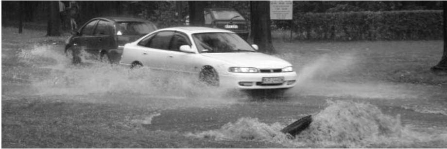
Figuur 1 Extreme zomerse regenval

temperatuur uit het drukveld kan voorspellen. Dat is de validatiestap. “Uit de validatie blijkt helaas dat het niet lukt om te zeggen of er een dag met een extreme temperatuur aankomt”, concludeert Doeswijk. “Vervolgens hebben we onderzocht of het resultaat beter zou worden wanneer we het drukveld beschrijven met tweedimensionale polynomen van de zevende of achtste orde, in plaats van met eendimensionale Legendrepolynomen. Dat brengt het aantal parameters terug tot zo’n vijftig. Maar ook deze aanpak leidt niet tot een goede voorspelling van extreem warme dagen.”