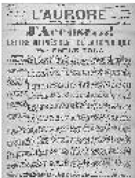
Alfred Dreyfus, Petit Journal en L'Aurore

niem Camille Marbo bekendheid als schrijfster verwierf. Painlevé had weer les gehad van Appell en hij had Borel bij de familie Appell geïntroduceerd. De grote maatschappelijke en politieke betrokkenheid van juist deze wiskundigen is eigenlijk afkomstig van de toevalligheid dat Hadamard de achteroom was van de vrouw van ene Alfred Dreyfus.