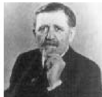
Jacques Salomon Hadamard (1865–1963), Charles Jean Gustave Nicolas Baron de la Vallée Poussin (1866–1962), Friedrich Moritz Hartogs (1874–1943) en Emile Borel (1871–1956)