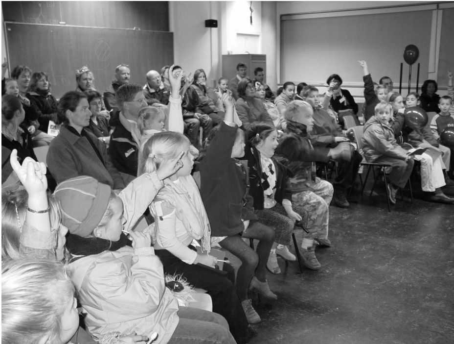
Actieve deelname van de kinderen bij het wetenschapstheater Eureka!

antwoord te vinden op deze vraag. De vragen hebben betrekking op alledaagse dingen zoals water, lucht, je lichaam of het heelal. De lezingen hebben een interactief karakter, kinderen worden gestimuleerd om mee te denken. Ze kunnen kleine proefjes uitvoeren en krijgen volop ruimte om vragen te stellen. De lezingen zijn voor kinderen vanaf 8 jaar. De lezingen vinden plaats in NEMO op elke derde zondag van de maand. De maandag erna verschijnt in Het Parool een inhoudelijk verslag van de lezing van de hand van wetenschapsjournaliste Margriet van der Heijden. Op de website www.kinderuniversiteit.nl staan de verslagen van alle lezingen gepubliceerd.