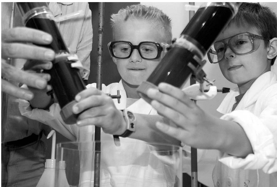
Twee jonge wetenschappers in spe experimenteren bij de kinderlezing Waarom is poep bruin?

Op dit moment ontwikkelt Robbert Dijkgraaf samen met studenten van de FNWI lesmateriaal voor basisscholen. Als winnaar van de Spinozapremie 2003 zal hij een deel van de