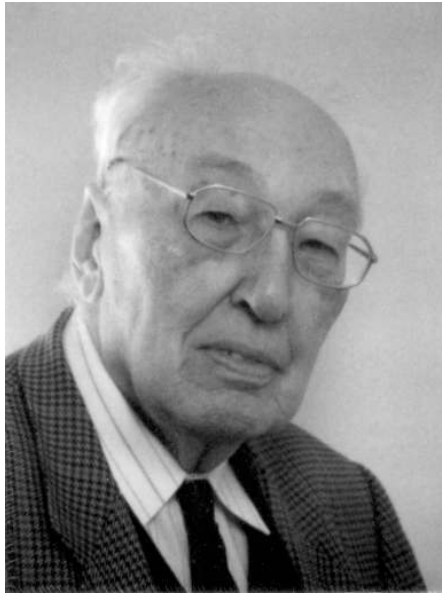
Christoffel Jacob Bouwkamp

Bouwkamps onderzoek op het gebied van de diffractietheorie is begonnen met zijn dissertatie. Sindsdien hebben in het bijzonder de problemen van akoestische of elektromagnetische diffractie door een cirkelvormige opening in een vlak scherm zijn voortdurende aandacht gehad. Belangrijk was zijn werk