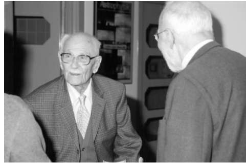
Vietoris bij zijn 108-ste verjaardag